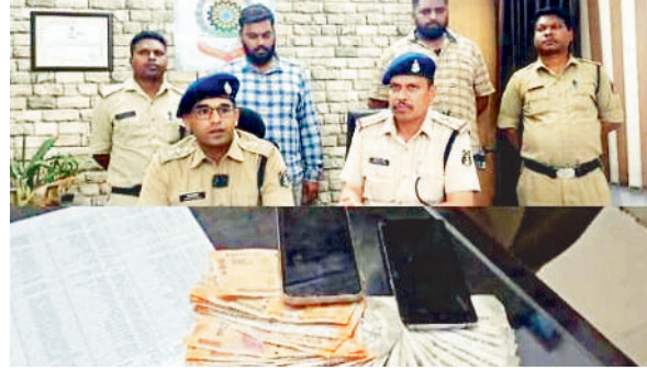
नकद समेत दो लाख का सामान जब्त।

जिले में बढ़ते सड़क हाथों के क्रम में सोमवार को घटित दुर्घटना के दौरान एक पिकअप की टक्कर से बाइक सवार दो युवकों की मौत हो गई। मामला लैलूंगा थाना क्षेत्र का है। इस संबंध में मिली जानकारी के अनुसार 1 अप्रैल को दोपहर लैलूंगा के रूडकेला पूर के पास एक पिकअप क्रमांक सीजी 15 एसी 5321 के चालक ने तेज एवं लापरवाही पूर्वक वाहन चलाते हुए बाइक सवार दो युवकों को जोरदार टक्कर मार दी। टक्कर इतनी जबरदस्त थी कि मौके पर ही एक युवक की मौत हो गई वहीं गंभीर रूप से घायल युवक को रायगढ़ मेडिकल कॉलेज लाया जा रहा था जहां रास्ते में ही उसकी मौत हो जाने की जानकारी मिली है। घटना के बाद से लैलूंगा पुलिस मौके पर पहुंचकर आगे की कार्रवाई में जुट गई है। बताया जा रहा है कि मृतक दोरोबांजा लैलूंगा थाना क्षेत्र के ही निवासी हैं। स्वजन गेरवानी गृह ग्राम लोकर गए। इधर उससे पहले ही गांव के ग्रामीणों ने शव को सड़क में रखकर मुआवजा अन्य की मांग को लेकर चक्काजाम कर दिए थे, वही उनके द्वारा कानूनी प्रक्रिया को पूरा कराया गया। तत्पश्चात दोपहर में शव को दाह संस्कार के लिए मृतक के रिश्तेदार व